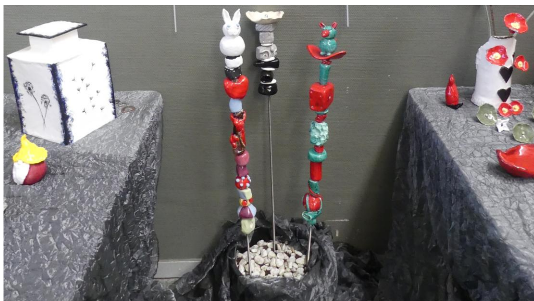
Une partie de l'exposition des travaux de l'année 2021-22

Exposition d'objets réalisés par les adhérents, en fin d'année